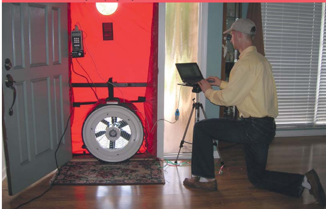
Test szczelności w budynku pasywnym – Blower Door

Straty ciepła na wentylację mają duży udział w bilansie energetycznym budynków. Aby osiągnąć standard pasywny konieczne jest ich ograniczenie. W tym celu stosuje się wentylację mechaniczną nawiewno-wywiewną z odzyskiem ciepła zamiast wentylacji grawitacyjnej. Wentylacja mechaniczna nie tylko pozwala na ograniczenie strat ciepła, ale i zapewnienie stałej wymiany powietrza w budynku. Sercem tego systemu jest centrala wentylacyjna wyposażona w wymiennik ciepła (krzyżowy, przeciwprądowy lub obrotowy) potocznie zwana rekuperatorem, gdzie powietrze wywiewane z budynku oddaje ciepło powietrzu nawiewanemu do budynku.