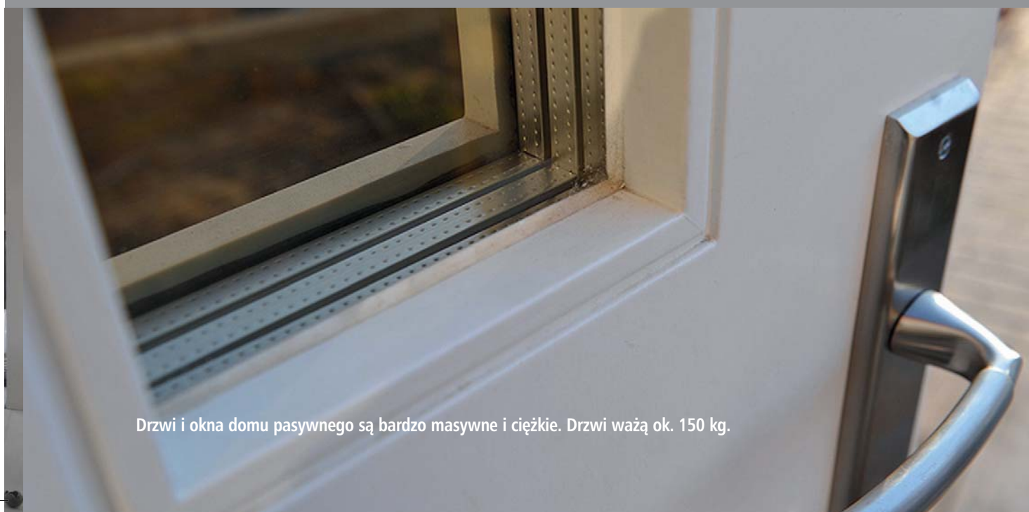
Drzwi i okna domu pasywnego są bardzo masywne i ciężkie. Drzwi ważą ok. 150 kg.

Wentylację całego budynku zapewnia system nawiewno-wywiewny, który nawiewa świeże powietrze do środka i wywiewa zużyte. W domu w Słomczynie w pokojach znajdują się charakterystyczne nawiewniki, a w kuchni i łazience wywiewniki. Taki układ zapewnia prawidłową cyrkulację powietrza w budynku. Należy jednak dodać, że pompa ciepła sprawdza się w tym domu ze względu na jego parametry pasywności: dużą izolacyjność ścian, dachu, stolarki okiennej i drzwiowej oraz wysoką szczelność powietrzną. Właściciele domów tradycyjnych, którzy wybraliby tę opcję ogrzewania swoich budynków nie byłiby zadowoleni. Aby ogrzać zwykły dom pompa musiałaby dmuchać znacznie większe ilości powietrza o temperaturze 50 – 60°C, a to mogłoby okazać się zupełnie nieoptyczne i mało komfortowe.