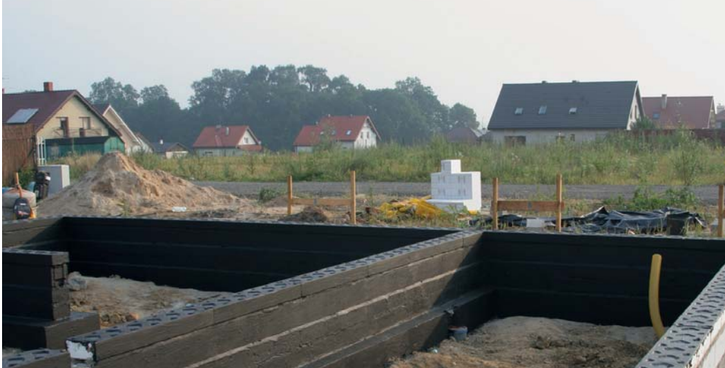
Wykorzystanie izolacyjnych pustaków cokołowych do likwidacji pionowych mostków ciepła