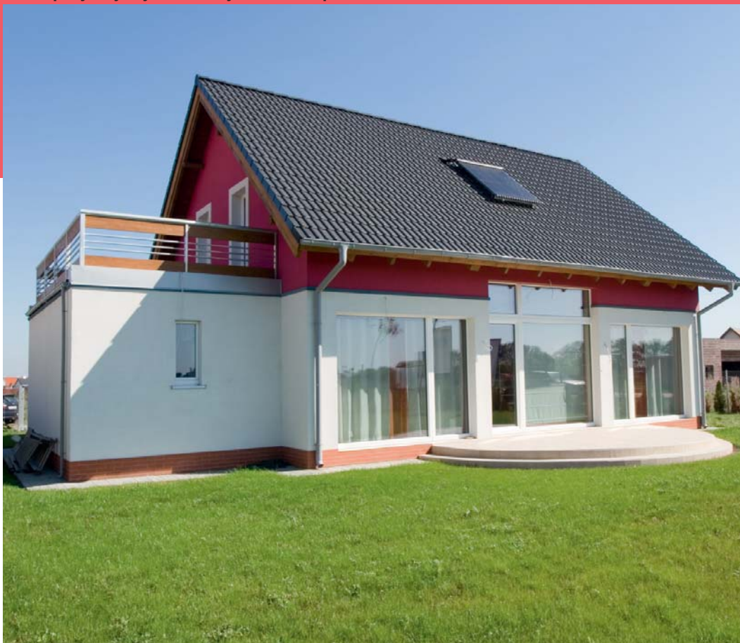
Dom pasywny wybudowany w Smolcu pod Wrocławiem