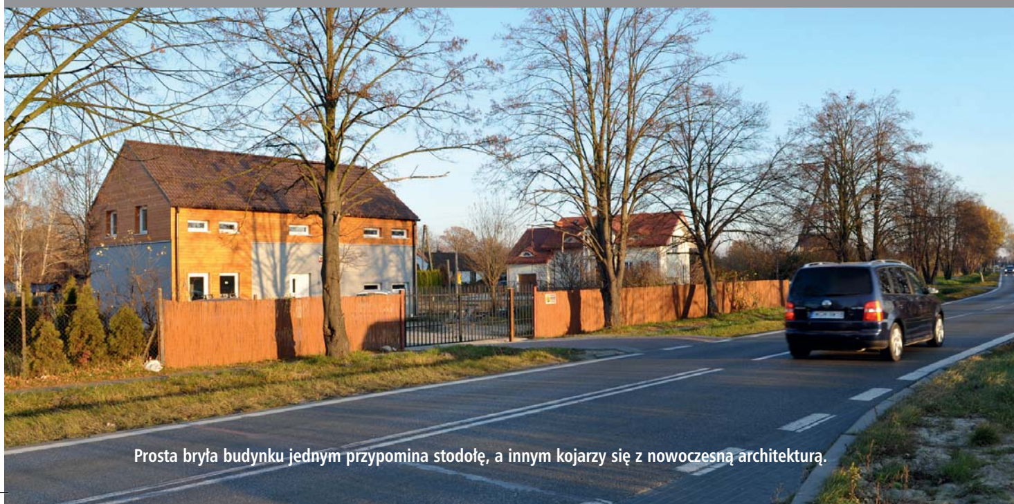
Prosta bryła budynku jednym przypomina stodołę, a innym kojarzy się z nowoczesną architekturą.

Istotnym założeniem domu pasywnego jest to, że zużywa nie więcej niż 15 kWh energii na \text{m}^2 rocznie na ogrzewanie. Powierzchnia domu państwa Kwiatkowskich wynosi 162,5 \text{ m}^2 . Żeby policzyć koszty, trzeba uwzględnić sprawność systemu grzewczego. W przypadku powietrznej pompy ciepła