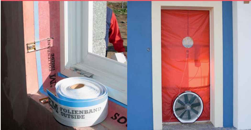
Folia paroszczelna przed przyklejeniem oraz próba ciśnieniowa