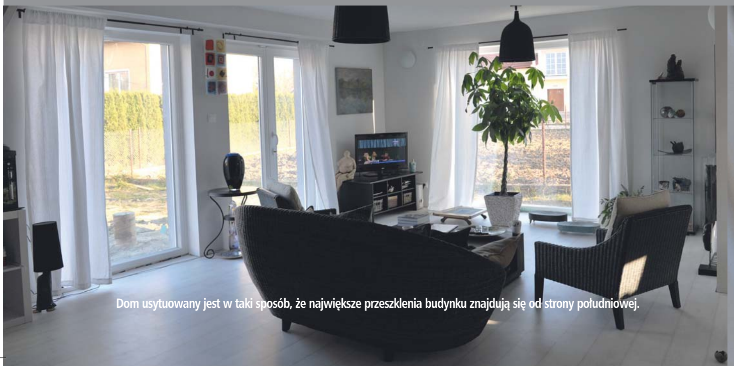
Dom usytuowany jest w taki sposób, że największe przeszklenia budynku znajdują się od strony południowej.

W połowie listopada 2009 roku rozpoczęły się prace nad płytą fundamentową, która w połowie grudnia uzyskała wytrzymałość pozwalającą na kontynuację prac konstrukcji domu. Fundamenty domów pasywnych są charakterystyczne. Nie ma tu łań fundamentowych i posadzki na gruncie. Jest płyta wylana na powierzchni całego domu. Jeszcze przed gwiazdką domek był zmontowany i można było rozpocząć zakładanie instalacji i wykańczać dom od zewnątrz. Do końca lutego był przestój związany z oczekiwaniem na kredyt i na instalacje. Potem trudność polegała na synchronizacji ekip. Czasem trwało to nawet 2 tygodnie zanim weszła kolejna ekipa. Rodzina wprowadziła się pod koniec sierpnia 2010 roku. Całe przedsięwzięcie trwało więc około 10 miesięcy i można powiedzieć, że ciągle jest w toku, ze względu na konieczność budowy tarasu i uporządkowania ogrodu. Ekipa producenta ścian Dom Polski 2000, która montowała ściany, miała wprawę w montowaniu domów prefabrykowanych. Pozostałe ekipy nie były wyspecjalizowane w domach pasywnych: hydraulik znalazł się po sąsiedzku, a elektryk przyjechał specjalnie z Radomia.