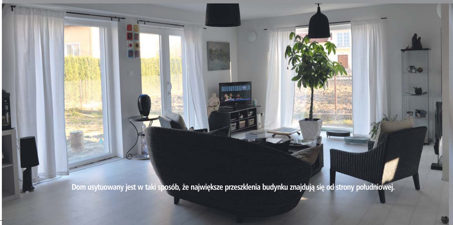
Dom usytuowany jest w taki sposób, że największe przeszklenia budynku znajdują się od strony południowej.

W połowie listopada 2009 roku rozpoczęły się prace nad płytą fundamentową, która w połowie grudnia uzyskała wytrzymałość pozwalającą na kontynuację prac konstrukcji domu. Fundamenty domów pasywnych są charakterystyczne. Nie ma tu łań fundamentowych i posadzki na gruncie. Jest płyta wylana na powierzchni całego domu. Jeszcze przed gwiazdką domek był zmontowany i można było rozpocząć zakładanie instalacji i wykańczać dom od zewnątrz. Do końca lutego był przestój związany z oczekiwaniem na kredyt i na instalacje. Potem trudność polegała na synchronizacji ekip. Czasem trwało to nawet 2 tygodnie zanim weszła kolejna ekipa. Rodzina wprowadziła się pod koniec sierpnia 2010 roku. Całe przedsięwzięcie trwało więc około 10 miesięcy i można powiedzieć, że ciągle jest w toku, ze względu na konieczność budowy tarasu i uporządkowania ogrodu. Ekipa producenta ścian Dom Polski 2000, która montowała ściany, miała wprawę w montowaniu domów prefabrykowanych. Pozostałe ekipy nie były wyspecjalizowane w domach pasywnych: hydraulik znalazł się po sąsiedzku, a elektryk przyjechał specjalnie z Radomia.