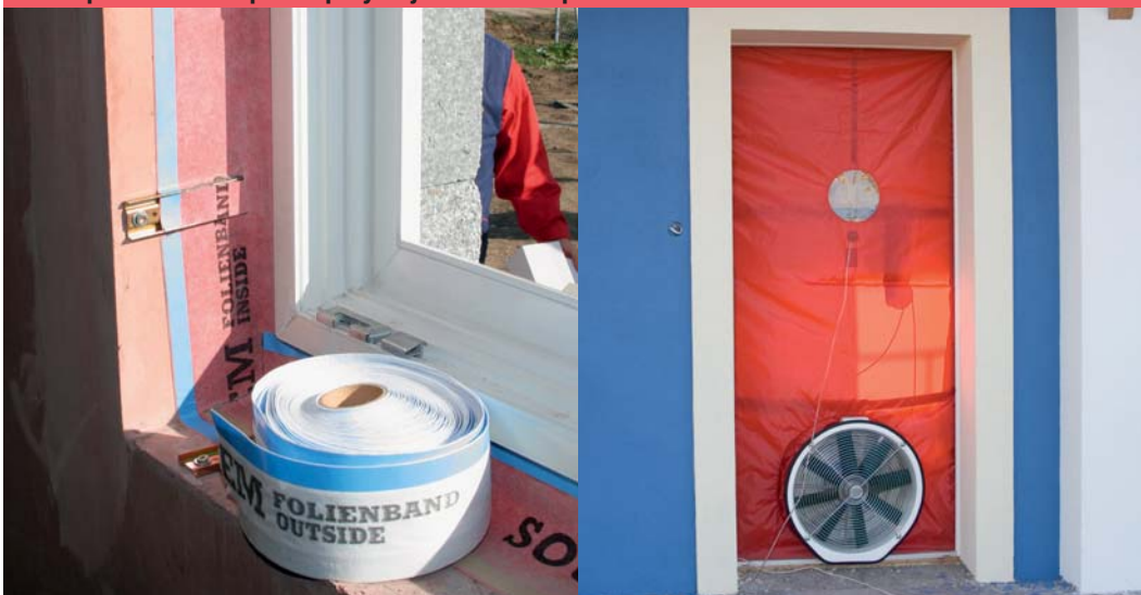
Folia paroszczelna przed przyklejeniem oraz próba ciśnieniowa