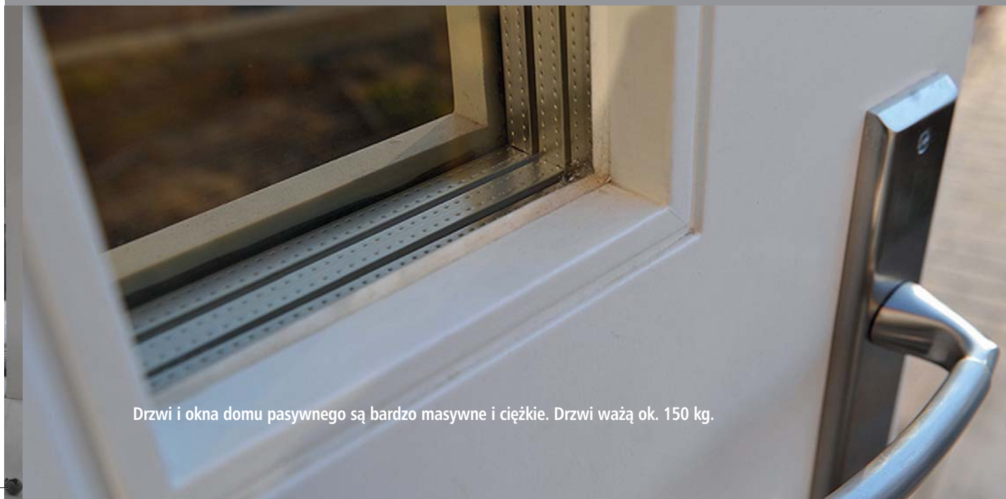
Drzwi i okna domu pasywnego są bardzo masywne i ciężkie. Drzwi ważą ok. 150 kg.

Wentylację całego budynku zapewnia system nawiewno-wywiewny, który nawiewa świeże powietrze do środka i wywiewa zużyte. W domu w Słomczynie w pokojach znajdują się charakterystyczne nawiewniki, a w kuchni i łazience wywiewniki. Taki układ zapewnia prawidłową cyrkulację powietrza w budynku. Należy jednak dodać, że pompa ciepła sprawdza się w tym domu ze względu na jego parametry pasywności: dużą izolacyjność ścian, dachu, stolarki okiennej i drzwiowej oraz wysoką szczelność powietrzną. Właściciele domów tradycyjnych, którzy wybraliby tę opcję ogrzewania swoich budynków nie byłiby zadowoleni. Aby ogrzać zwykły dom pompa musiałaby dmuchać znacznie większe ilości powietrza o temperaturze 50 – 60°C, a to mogłoby okazać się zupełnie nieoptyczne i mało komfortowe.